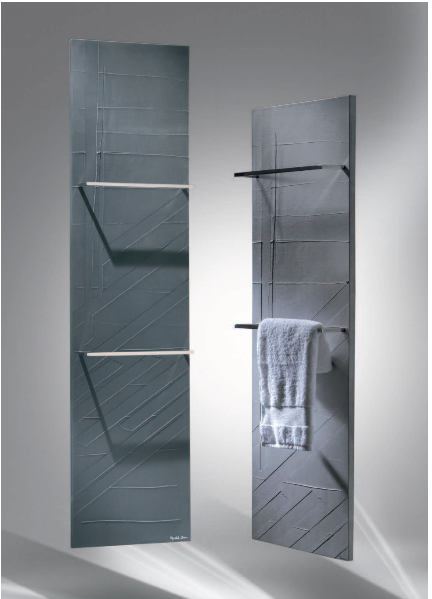
RADIATEUR EN PIERRE OLYCALE® | CHALEUR RAYONNANTE À BASSE TEMPÉRATURE Radiator in OLYCALE® stone – Radiant heat at low temperatures