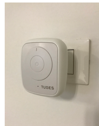
REGMAN#01B (Entièrement BLANC)