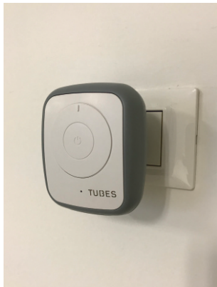
REGMAN#01G (Corps GRIS façade Blanche)